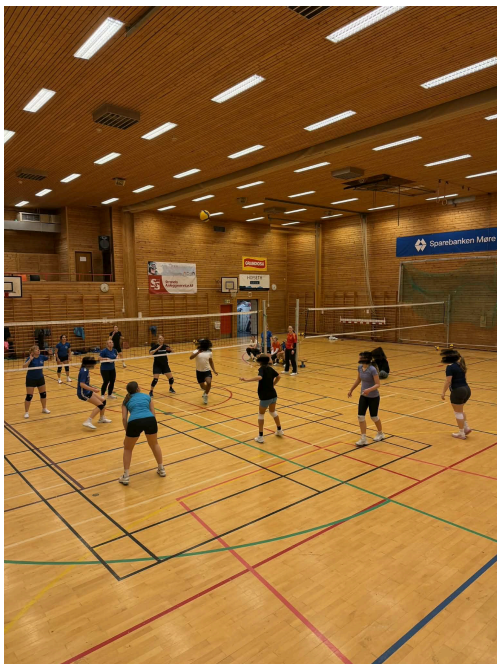
Foto: Damelaget i sving mot Vestborg VGS

Vi er i dialog med Intersport Stranda, som har vore i kontakt med leverandør for å kunne tilby oss volleyball-drakter og shortsar til kampar og turneringar. Det skal kjøpast inn drakter til alle 3 laga, og vil ha relevant SBM-logo.