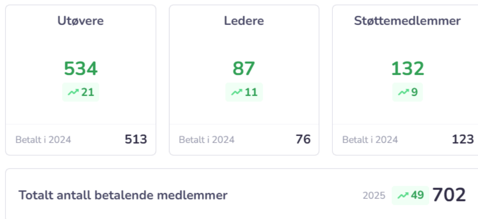
Bilde 2: Fordeling av betalende medlem ut frå rolle for 2025

Som skrive over har AU initiert utlevering av “flyers” i postkasser til alle i Stranda tettstad på slutten av året for å forsøke å auke medlemstala. Dette kan potensielt hjelpe på med å skaffe støttemedlem, som er kjærkomment for idrettslaget. Vidare vurderer AU at det er viktig å ha fokus på antal betalende medlem ettersom dette gir gevinstar i form av lokale aktivitetsmidlar, og eventuelt på sikt også for andre overføringar frå NIF og/eller stat.